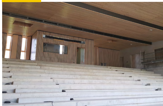
Amphithéâtre 350 places