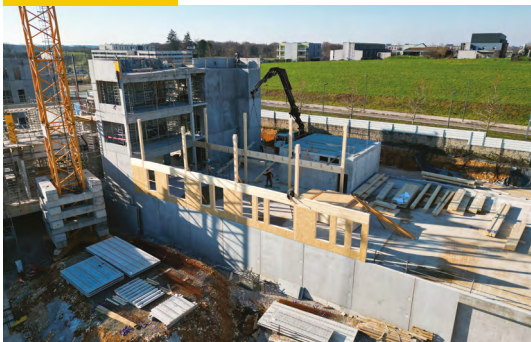
Démarrage de l'ossature bois