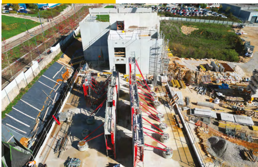
Les murs amphis et salles de cours