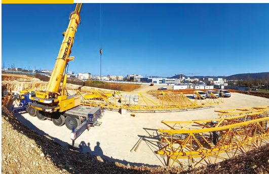
Montage de la première grue et fondations spéciales