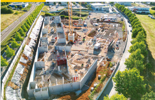
Vue aérienne des sous-sols