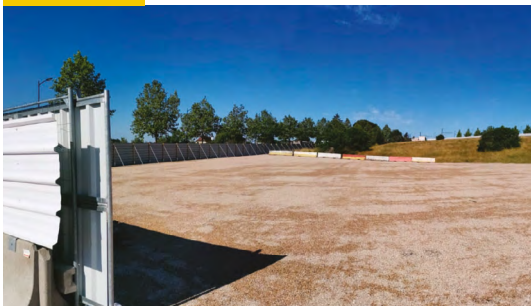
Démarrage des travaux