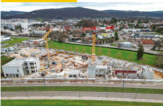
Vue d'ensemble du chantier