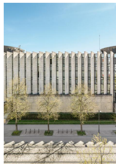
Conseil régional à Dijon

Les visiteurs pourront se promener librement dans le bâtiment et les jardins du Département ou suivre des visites guidées. L'histoire de l'édification du bâtiment témoigne des enjeux de l'architecture de l'administration, mais aussi des contraintes rencontrées par les constructions nouvelles au sein des sites patrimoniaux, compte tenu de sa situation en limite du secteur sauvegardé de Dijon.