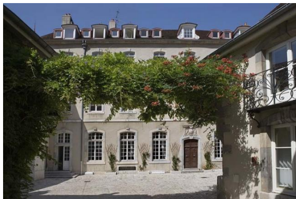
Hôtel de Grammont

L'hôtel de Région de Bourgogne-Franche-Comté vous ouvre ses portes à l'occasion des Journées européennes du patrimoine. Les visiteurs pourront découvrir aussi bien la salle Edgar Faure, qui a accueilli les assemblées jusqu'en 2016, que l'hôtel particulier du XVIII e siècle (petit salon, salon d'apparat et salon Raymond Forni) ou encore des vestiges archéologiques du I er siècle avant J-C. Un véritable voyage à travers l'histoire !