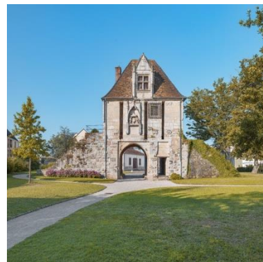
Porte de Comté d'Auxonne.