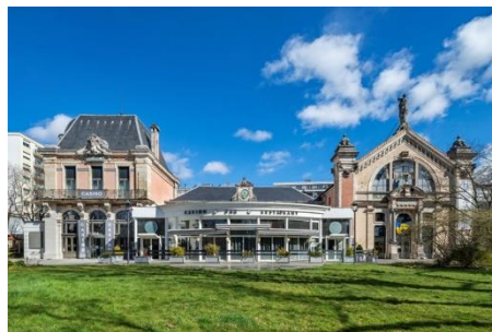
Casino (façade sur le jardin) à Besançon.