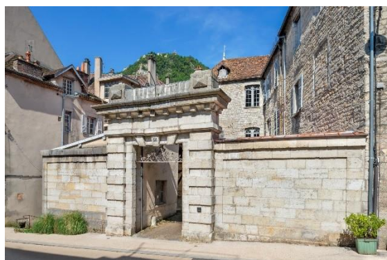
Hôtel de Falletans à Salins-les-Bains.