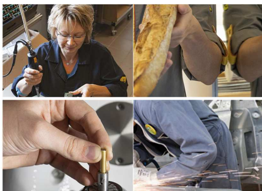
Conférence économique régionale 5 avril 2023 – DIJON

Le développement économique fait partie de politiques majeures de la Région. En 2023, elle consacrera 72,2 M€ à sa politique en faveur du développement économique, de l'emploi et de l'économie sociale et solidaire. Son rôle d'orientation de l'action publique économique est acté par la loi depuis 2015.