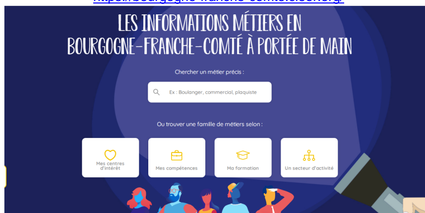
La page d'accueil de Cléor Bourgogne-Franche-Comté

https://bourgogne-franche-comte.cleor.org/