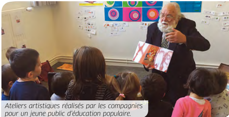
Ateliers artistiques réalisés par les compagnies pour un jeune public d'éducation populaire.