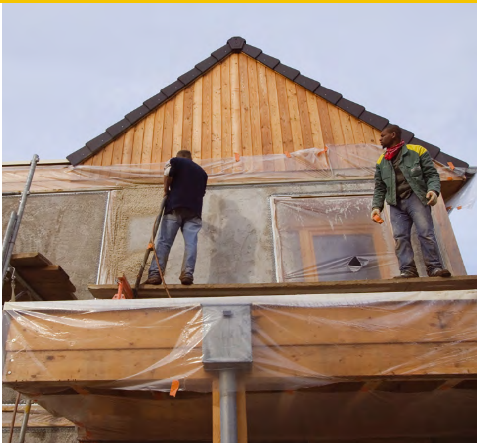
Les particuliers propriétaires de maisons individuelles, notamment, peuvent bénéficier d'un accompagnement pour leurs projets de travaux ou rénovation en BBC.