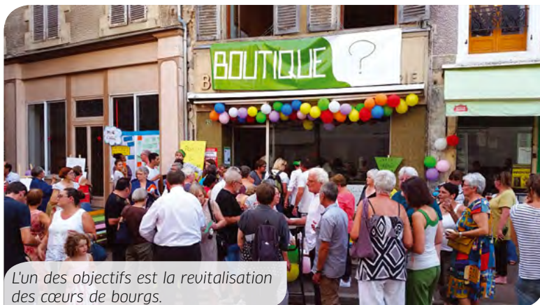
L'un des objectifs est la revitalisation des cœurs de bourgs.

tion. Commerces, vie quotidienne, logement... c'est un projet global et unique. On ne le ferait pas sans ce contrat qui donne une vraie capacité d'initiative aux territoires. Ici, on invente une ruralité moderne et active ! »