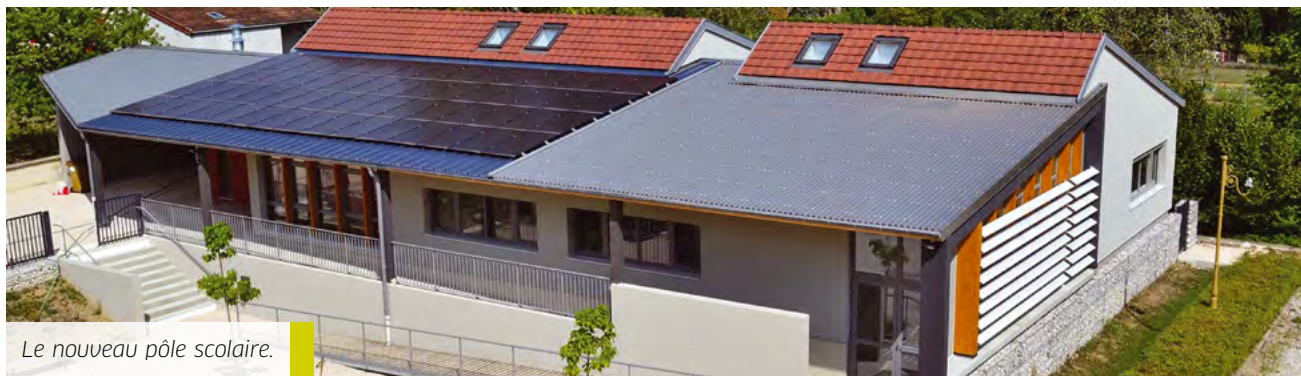
Le nouveau pôle scolaire.

INITIATIVE ■ Un bâtiment à énergie positive, un bâtiment basse consommation, des panneaux photovoltaïques et une chaufferie bois, la commune de Veuvev-sur-Ouche (21) mue en faveur de l'environnement.