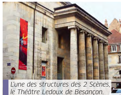
L'une des structures des 2 Scènes, le Théâtre Ledoux de Besançon.

neuf spectacles conjoints. Une nouvelle occasion de partager leurs expériences et leurs savoir-faire, de mutualiser leurs ressources et d'atteindre de nouveaux publics. Un projet à 1,5 million d'euros, soutenu à hauteur de 566 324 euros par le programme Interreg France-Suisse par le biais du fonds FEDER. ■